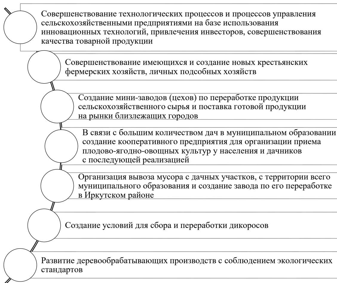
Рис. 2. Рекомендации по развитию сельскохозяйственного и промышленного производства в Хомутовском МО

Проблема занятости населения, развития малых предприятий является важной сферой экономики муниципального образования, она имеет большое социальное значение. Основной целью развития предпринимательства является поддержка и развитие малого и среднего предпринимательства.